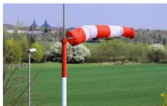
Mit ihrem Frühlings-Release will die Scopevisio AG für frischen Wind sorgen.

Das Release Spring 2011 von Scopevisio soll mit Neuerungen rund um die cloudbasierte Unternehmenssoftware des Anbieters für frischen Wind im Markt der Business-Anwendungen sorgen.